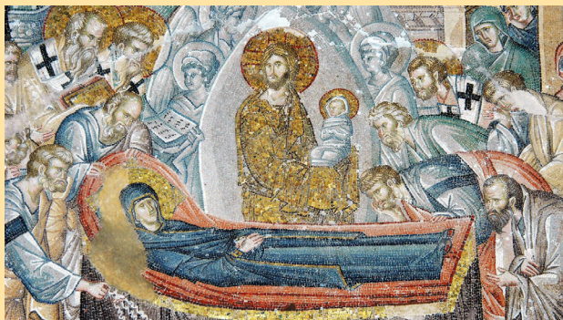
Dormició de la Verge Maria, Església de Sant Salvador de Cora, Istanbul, Segle XIV

A les DEU del matí, Missa matinal al Santuari de Lurdes . A 1/4 d'UNA del migdia, Missa solemne , a l'església parroquial.